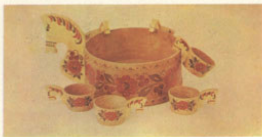
Сорокин И. К. Ковш. Вереста, роспись.