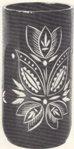
Куркин П. М. Ваза-салфетница. Дерево, лак, резьба.