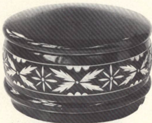
Шевцов А. В. Шкатулка. Дерево, лак, резьба.