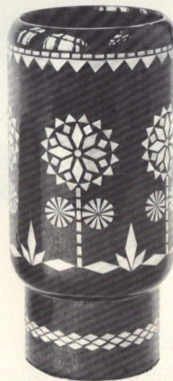
Бобков Н. А. Ваза-карандашница. Дерево. Инкрустация соломкой.