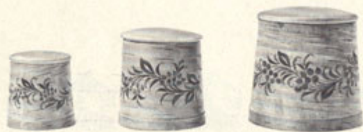
Шецов А. В. Набор поставков. Береста, роспись.