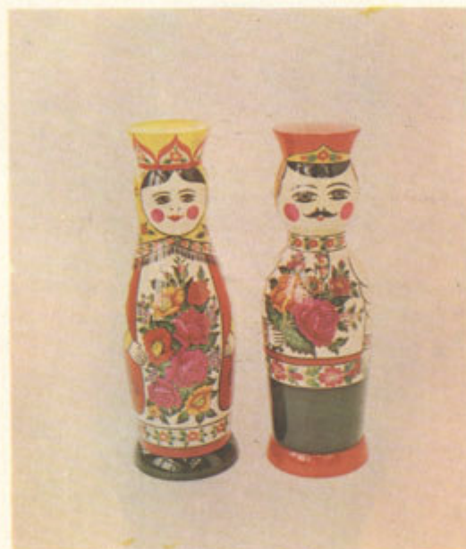
Сорокин И. К. Матрешки. Сувенир свадебный. Роспись.