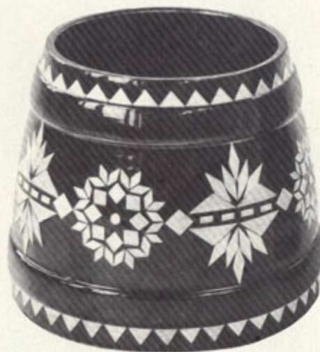
Силаотин Ю. А. Кадочка. Дерево. Инкрустация соломкой.