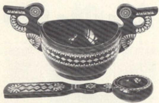
Бобков Н. А. Ковш. Шецов А. В. Ложка. Дерево. Инкрустация соломкой.